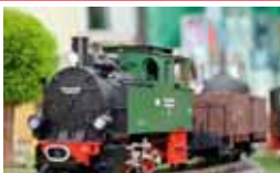
Anlage nach Absprache ganzjährig für Gartenbahnfreunde mit eigenen Fahrzeugen kostenlos nutzbar.

Bad Liebenwerda Natürlich. Herzlich. Gastlich.